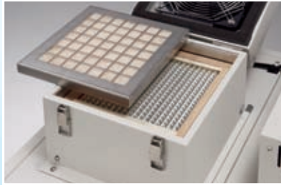
プレフィルター及びHEPAフィルター